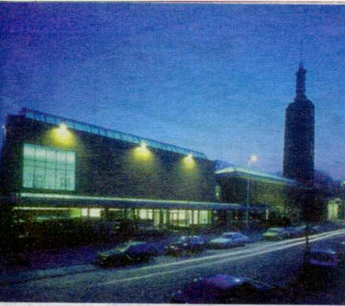
Музей Бойманс-ван Бейнинген в Роттердаме, а справа — Музей искусств имени Богдана и Варвары Ханенко в Киеве.