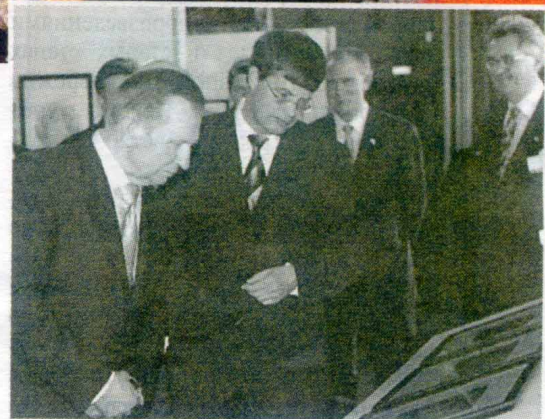
Леонид Кучма и премьер-министр Голландии Ян Петер Балкененде на вернисаже в Киеве.

Куда же в данном случае подевался принятый в международном праве принцип взаимности? Похоже, украинские эксперты, готовившие «исследование» для своего правительства, не сочли нужным заметить эту проблему. А может, они просто не владеют информацией? Такое трудно себе представить. Но на всякий случай подельюсь тем, что мне хорошо известно.